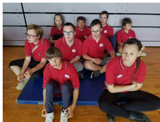
Slika 14: Člana ekipe z legionarjema in ekipa Doma Antona Skale