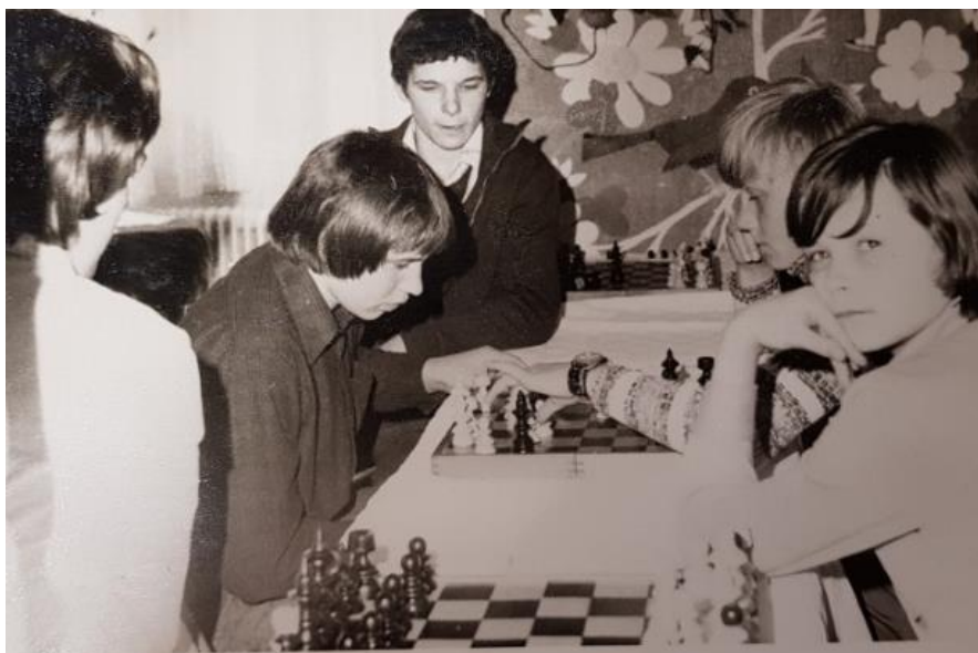
Slika 6: Šahovsko tekmovanje

Naslednji kroniški zapis pravi, da smo bili v šol. I. 1994/1995 organizator tekmovanja, katerega smo poimenovali Igre brez meja. Poleg že vsakoletno sodelujočih ekip so se nam tokrat pridružili še varovanci iz domov v Murski Soboti, Celju in Novem mestu. Namen iger je vsekakor bil spoznavati nove prijatelje, same igre pa so postale bolj kot tekmovalne, le še razvedrilne. Zaključek smo popestrili s piknikom in glasbo (zapisi v Kroniki doma 1996/97).