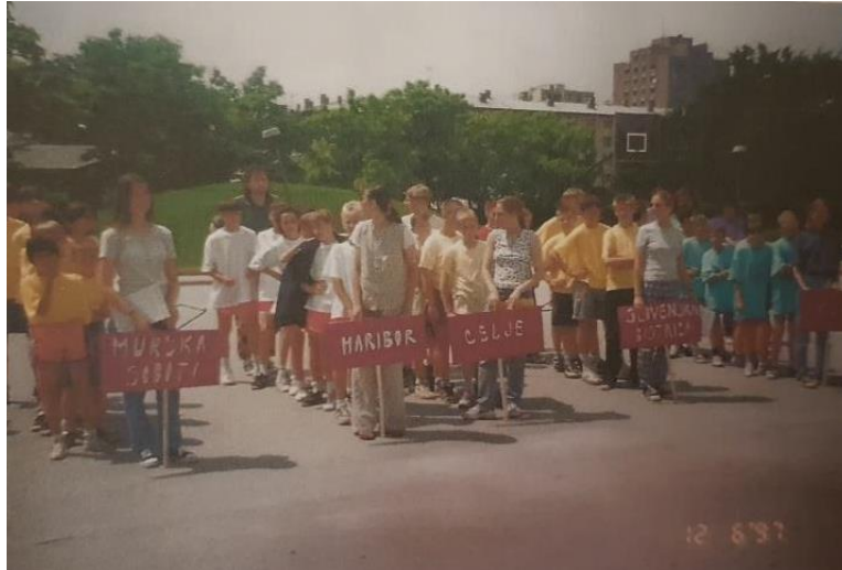
Slika 8: Igre v Celju

In tako so igre, zdaj že, v različnih športnih disciplinah s pridihom tekmovalnega duha bile organizirane vsako leto v enem izmed domov za otroke s prilagojenim programom. V juniju 1997 je športno-družabno srečanje potekalo v Celju, naš dom pa je sodeloval z vrhunsko pripravljeno ekipo (zapisi v Kroniki doma 1996/97).