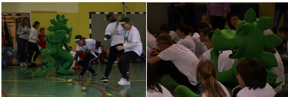
Slika 16: Med tekmovanjem in ekipa z ljubljanskim zmajem

Prav tako ni bil igram in drugim športnim dejavnostim naklonjen čas kovida, kateri nam je prekrizal vse načrte za daljše obdobje.