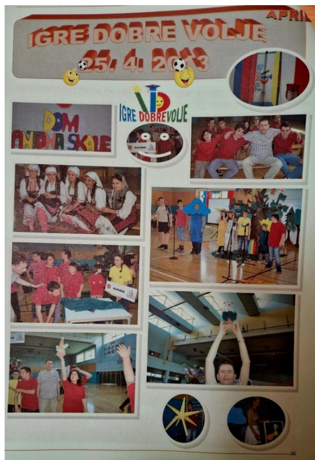
Slika 13: Ostanimo prijatelji...

Nato so se igre odvijale letno na različnih lokacijah. Večine letnih smo se udeležili, nekaterih pa tudi ne, zaradi drugih obveznosti ali zasedenosti tekmovalcev.