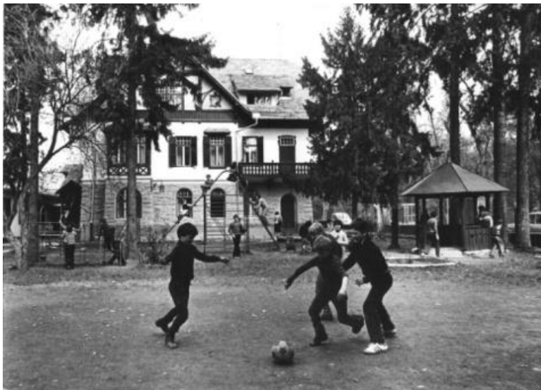
Slika 2: Igra z žogo (vir: Dom Antona Skale)

Termin »delo z igro« označuje delo strokovnjakov, ki pri delu z otroki in mladostniki uporabljajo igro tako, da jo omogočajo in bogatijo. Brown (2010) definira delo z igro kot proces prilagajanja celotnega okolja z namenom izboljšanja možnosti za igro, Hughes (2013, v Krašovec, 2016) delo z igro opiše kot »znanost in umetnost omogočanja otroške igre«. Vsaka igra pa ponuja otrokom in mladostnikom zadovoljstvo in veselje in je povezana z lepim rezultatom.