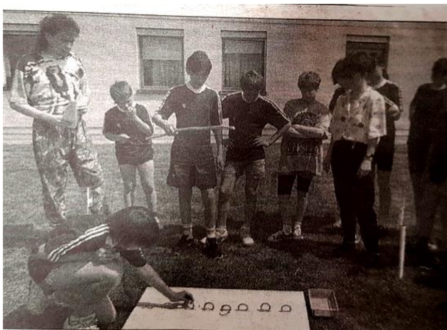
Slika 7: Ekipa Iger brez meja

Naslednji kroniški zapis pravi, da smo bili v šol. I. 1994/1995 organizator tekmovanja, katerega smo poimenovali Igre brez meja. Poleg že vsakoletno sodelujočih ekip so se nam tokrat pridružili še varovanci iz domov v Murski Soboti, Celju in Novem mestu. Namen iger je vsekakor bil spoznavati nove prijatelje, same igre pa so postale bolj kot tekmovalne, le še razvedrilne. Zaključek smo popestrili s piknikom in glasbo (zapisi v Kroniki doma 1996/97).