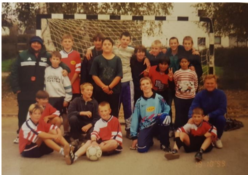
Slika 10: Nogometno športna ekipa iz leta 1999