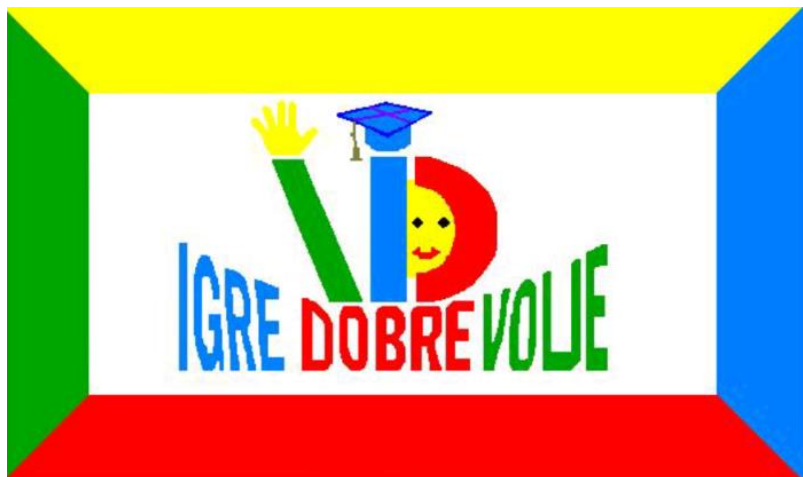
Slika 4: Zastava Igre dobre volje