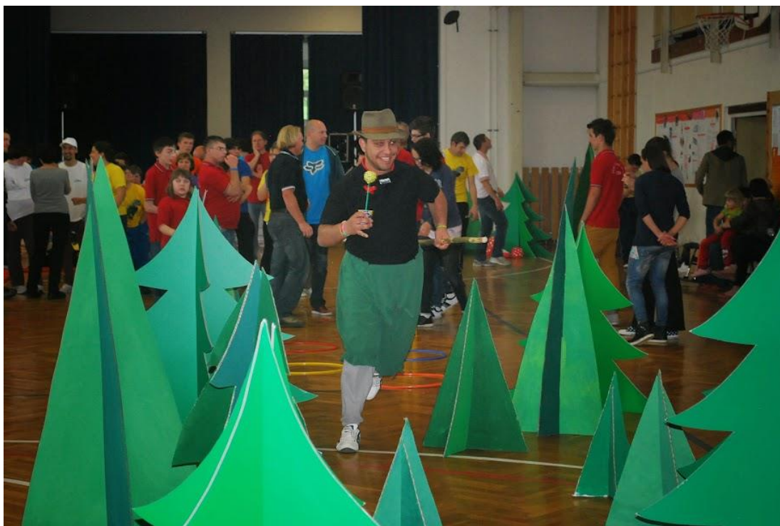
Slika 12: V boju za medaljo

Zmagovalci iger so bile vse ekipe, CUDV Dobrna pa je prevzela zastavo, do organizacije iger v naslednjem šolskem letu (zapisi v Kroniki doma 2012/13).