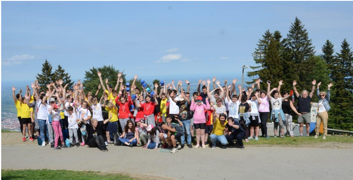
Slika 17: V tekmovalnem duhu na Pohorju

Sledila še je slavnostna podelitev zlatih medalj v obliki lisičke vsem udeležencem, nato pa smo se še malo podružili na Pohorju. Polni čudovitih vtisov in sklenjenih novih prijateljstev smo se z gondolo odpravili nazaj v dolino in se poslovili z mislijo na naslednje Igre dobre volje.