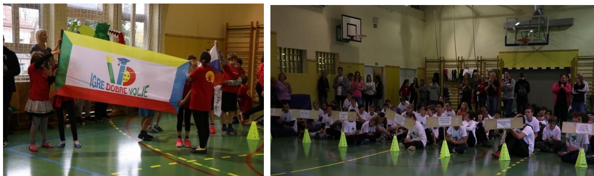
Slika 15: Zastava in ekipe Iger dobre volje v Ljubljani

Leta 2019 so se Igre dobre volje odvijale v Ljubljani (zapisi v Kroniki doma 2018/19).