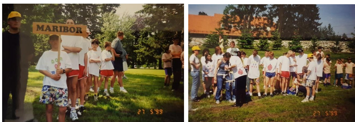
Slika 11: Igre dobre volje 27. maja 1999 v Slovenski Bistrici

25. 4. 2013 so na Srednji lesarski šoli Maribor potekale Igre dobre volje, katere je organiziral Dom Antona Skale Maribor. Sodelovalo je devet domov, in sicer: takrat Dijaški dom Murska sobota, takrat Dijaški dom Ptuj, dom pri OŠ Minke Namestnik Sonje, dom pri OŠ Glazija, dom pri Zavodu Janeza Levca, dom pri OŠ Dragotina Ketteja, CUVD Dobrna, CIRIUS Vipava in izvrstno moštvo organizatorja. Zbranih okrog sto tekmovalcev pa je vzpodbujalo še več kot petdeset gledalcev in spremljevalcev ekip.