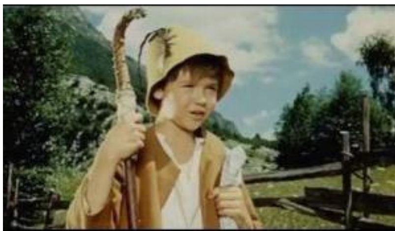
Slika 1: Kekec