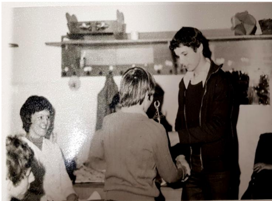
Slika 3: Prevzem pokala

Za Igre dobre volje velja, da so ena izmed najbolj pozitivnih aktivnosti za otroke in mladostnike s posebnimi potrebami. Na sami prireditvi lahko povežemo vse od glasbe, športa in plesa, vse točke pa prepleta tudi duh tekmovalnosti in dobra volja.