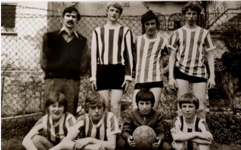
Slika 5: Prva nogometna ekipa (vir: Dom Antona Skale)

Prvotne Igre dobre volje so potekale v obliki sodelovanja med domovi podravske regije (Ptuj, Slovenska Bistrica, Maribor) na srečanjih gojencev, ki so se pomerili med seboj v malem nogometu in šahu. Iz kronike Doma Antona Skale Maribor lahko razberemo, da se je prvo tekmovanje ekip v malem nogometu odvijalo 22. 4. 1977 v Ptujju. Moštvo Doma Antona Skale je bilo uvrščeno na drugo mesto (zapisi v Kroniki doma 1978/79).